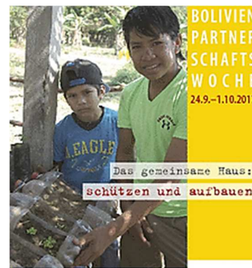
ERNTEDANK Kollekte für Bolivien